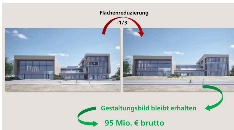
Nach wie vor ein Hingucker: Das Gestaltungsbild bleibt trotz der Änderungen erhalten.

Eine deutliche Vorfreude auf das neue AQUAFÖHR ist jetzt bei jeder Verhandlung und in jeder Sitzung spürbar. Man scheint fast angekommen zu sein. Die Planungen sind jetzt weit fortgeschritten. Das neue, attraktive AQUAFÖHR scheint zum Greifen nah. Das neue Erlebnisbad scheint genau dies zu werden: Ein Erlebnis!